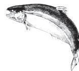
Skotsk Atlanterhavs Laks